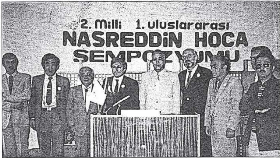
Vefatından yaklaşık 10 gün önce katıldığı bir sempozyumda