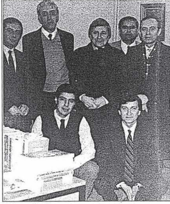
Mimar Sinan Üniversitesinde meslektaşlarıyla