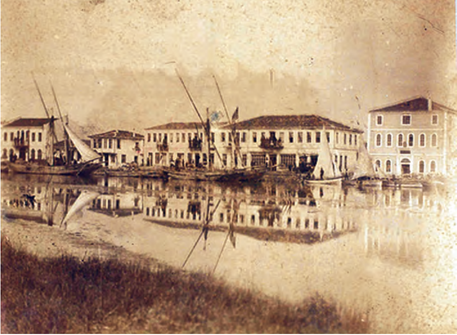
Karaağaç İskelesi