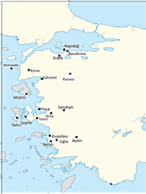
Harita 2: Elkas'ın İltizamı Kapsamındaki Yerleşim Birimleri

Yahudi Elkas'ın birkaç sene elinde tuttuğu iltizamının kapsamındaki yerlerin aynı zaman da bir gümrük bölgesini ifade eden Ege ve Marmara bölgesinde yer aldığı gözleniyor. 67 Bu mukataa, Genç'in "mukataaların içerdiği vergi unsurlarının çeşitliliğiyle kapsadığı mekânın genişliği arasında genellikle ters orantı bulunur"